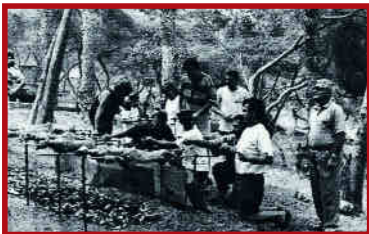
Το Πάσχα των Ελλήνων στο Περού (σε Περουβιανές εφημερίδες).