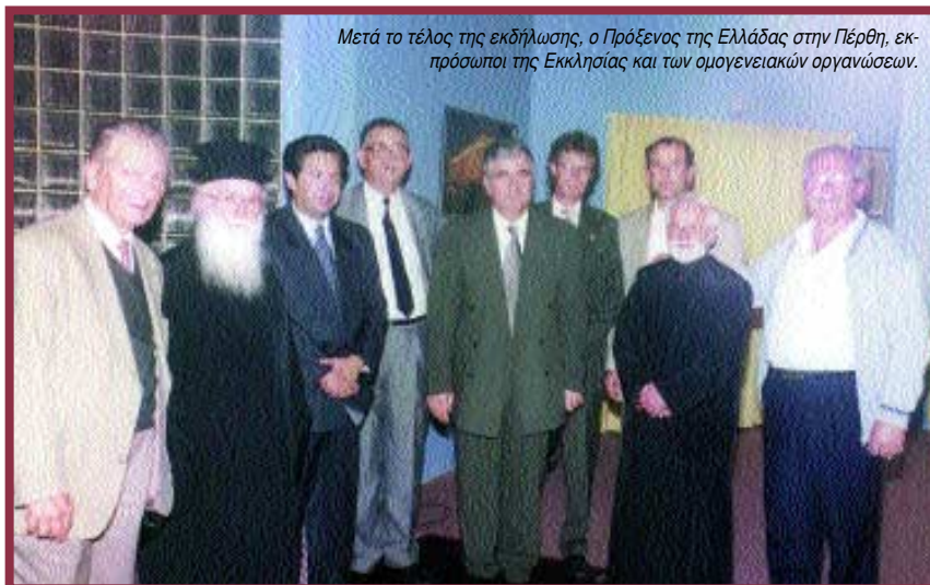
Μετά το τέλος της εκδήλωσης, ο Πρόξενος της Ελλάδας στην Πέρθη, εκπρόσωποι της Εκκλησίας και των ομογενειακών οργανώσεων.