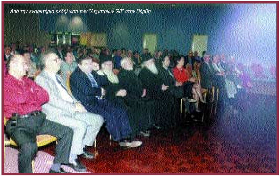
Από την εναρκτήρια εκδήλωση των "Δημητρίων '98" στην Πέρθη.

Τέλος ο αρχηγός της πολιτειακής αντιπολίτευσης Τζον Μπράμπι, που είναι και σκιώδης υπουργός για τα πολυπολιτισμικά θέματα, στο μήνυμά του με την ευκαιρία των «Δημητρίων '98» τονίζει ότι η ελληνική παροικία στην πολιτεία της Βικτώριας, είναι πολύ καλά εγκαταστημένη και πολύ ισχυρή σε ανθρώπινο δυναμικό, ενώ η πόλη