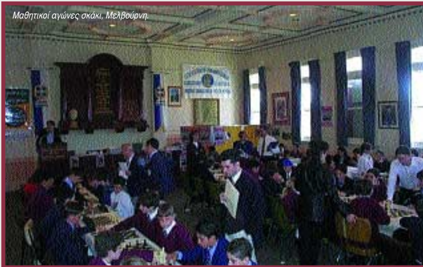
Μαθητικοί αγώνες σκάκι, Μεμβούρη.

ξιωματούχοι της κυβέρνησης και της αντιπολίτευσης.