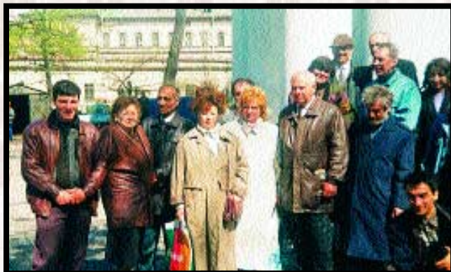
Οι Έλληνες της Αγίας Πετρούπολης σήμερα προσπαθούν να είναι μαζί και στις γιορτές μεγάλες και μικρές.