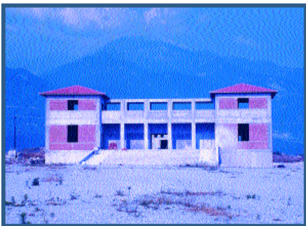
"Το Σπίτι του Αλέξανδρου".

Στο τιμόνι της όλης προσπάθειας στον ελλαδικό χώρο βρίσκεται εξ αρχής ο καθηγητής Αρχαιολογίας στο Αριστοτέλειο Πανεπιστήμιο Θεσσαλονίκης και βουλευτής Επικρατείας Δημήτρης Παντερμαλής , επικεφαλής του ανασκαφικού έργου στο Δίον και σκαπανέας του επιστημονικού χαρακτήρα του ιδρύματος, που φιλοδοξεί να αποτελέσει φυτώριο της σύγχρονης ιστορικής μελέτης γύρω από τον Αλέξανδρο, το βίο και την πολιτεία του στα βάθη της Ανατολής. Ο κ. Παντερμαλής είναι Πρόεδρος της Εκτελεστικής Γραμματείας του Ιδρύματος στην Ελλάδα . Η έδρα του Ιδρύματος βρίσκεται στη Νέα Υόρκη και λειτουργεί με την επωνυμία "Διεθνές Ιδρυμα Μεγας Αλέξανδρος" (Ν.Π.Ι.Δ.). Την όλη προσπάθεια στήριξε από τα πρώτα της βήματα και ο πρόσφατα εκλιπών τέως Πρόεδρος της Δημοκρατίας, Μακεδόνας στην καταγωγή, Κωνσταντίνος Καραμανλής , ο οποίος υπήρξε και επίτιμος πρόεδρος του Ιδρύματος.