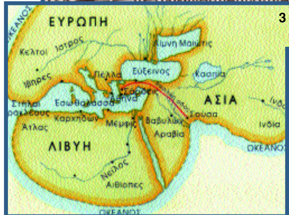
1. Παράσταση των υποτελών λαών του Μεγάλου Βασιλιά, από το βάθρο του αγάλματος του Δαρείου Α' που βρίσκεται στην Τεχεράνη 2. Ο κρατήρας της Ελλάδας και της Ασίας γνωστός ως αγγείο των Περσών (Εθν. Μουσείο Νεάπολης, Ιταλία) 3. Η Οικουμένη μετά τον Αλέξανδρο. 4. Η Οικουμένη μετά τον Αλέξανδρο.